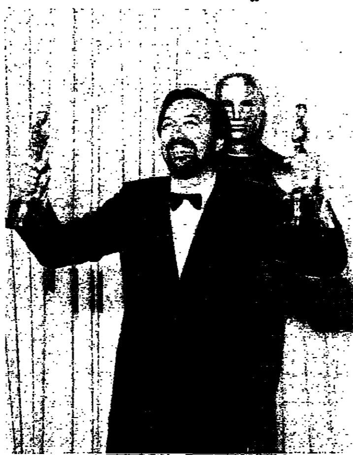
جيمس ل. بروكس مخرج «شروط اللودة»، وخمس أوسكارا